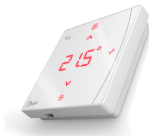
Danfoss Icon2™ Featured RT (IR sensor) 088U2122

Danfoss Icon2™ RT er en produktserie af trådløse termostater, der giver frihed til at placere din termostat uafhængigt af begrænsninger på grund af ledninger i væggen. Termostaternes diskrete udseende og minimalistiske design med en dybde på kun 16 mm giver dem en elegance og gør, at de går i ét med omgivelserne.