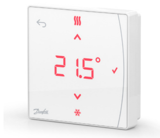
Danfoss Icon2™ RT 088U2121