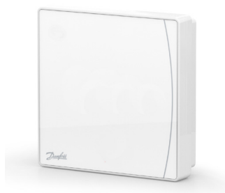
Danfoss Icon2™ Sensor 088U2120